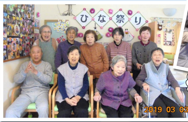
レクはいつも真剣よ！