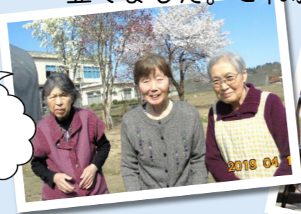
桜がみれて嬉しいわ♪