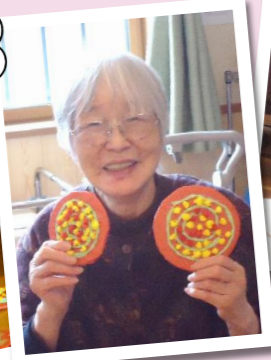
お手製のお好み焼き返しレクよ♪