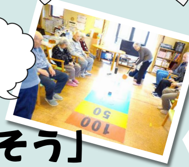
それ！高得点を狙うぞ！