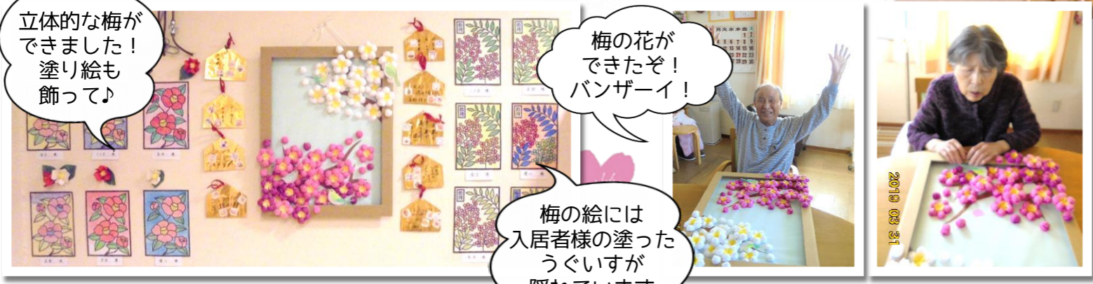
立体的な梅ができました! 塗り絵も飾って♪