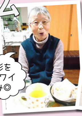
ひな人形を脇にワイワイお茶飲み◎