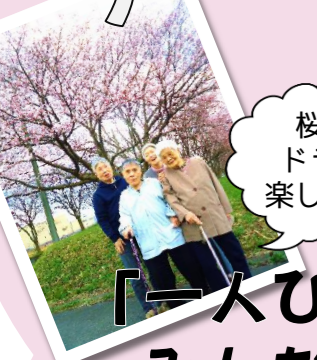
桜を観にドライブ♪楽しかった♪