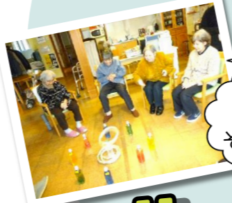
よ～く狙って～～それ、どうだ！