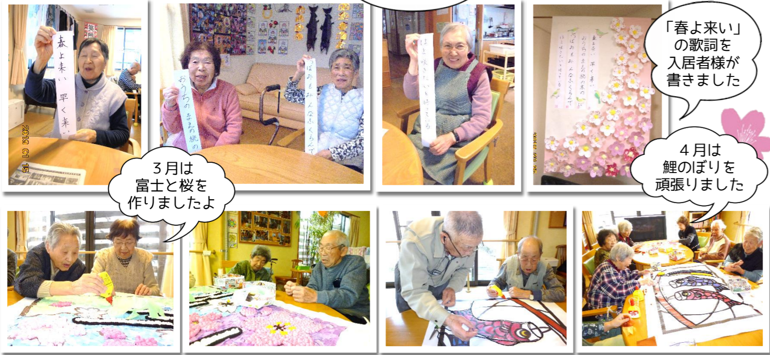
3月は富士と桜を作りましたよ