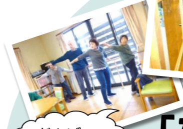
がんばって体操で体を動かすぞ！