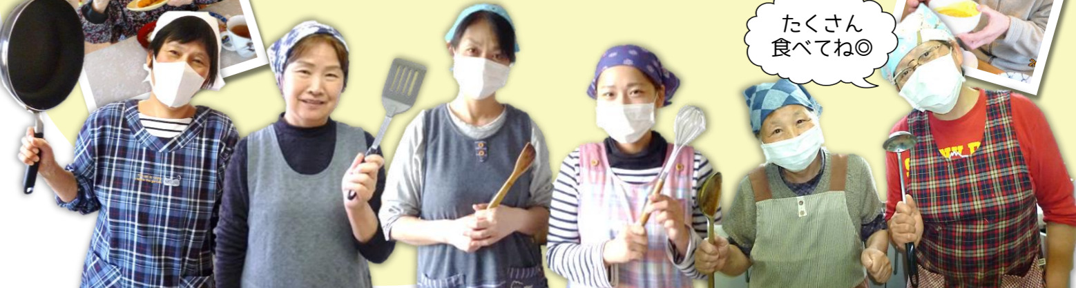
たくさん食べてね◎