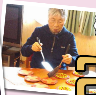
いつも楽しいレクで笑っちゃう♪