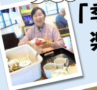
お手伝いが日課なの