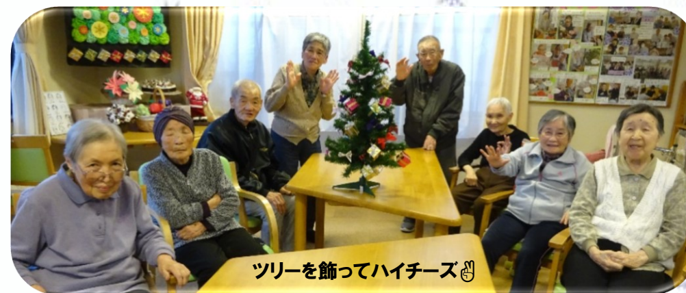
ツリーを飾ってハイチーズ