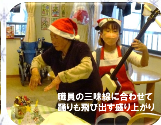
職員の三味線に合わせて踊りも飛び出す盛り上がり