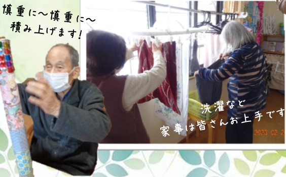
慎重に〜慎重に〜 積み上げます!

それぞれ職員見守りのもとで生活をしています。洗濯や掃除などの家事や生け花、体力作り、体操、ゲーム、ちぎり絵や暖かい季節には外での外気浴、散歩などを行っています。