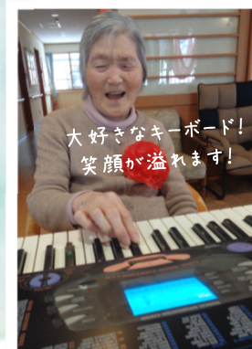
大好きなキーボード! 笑顔が溢れます!